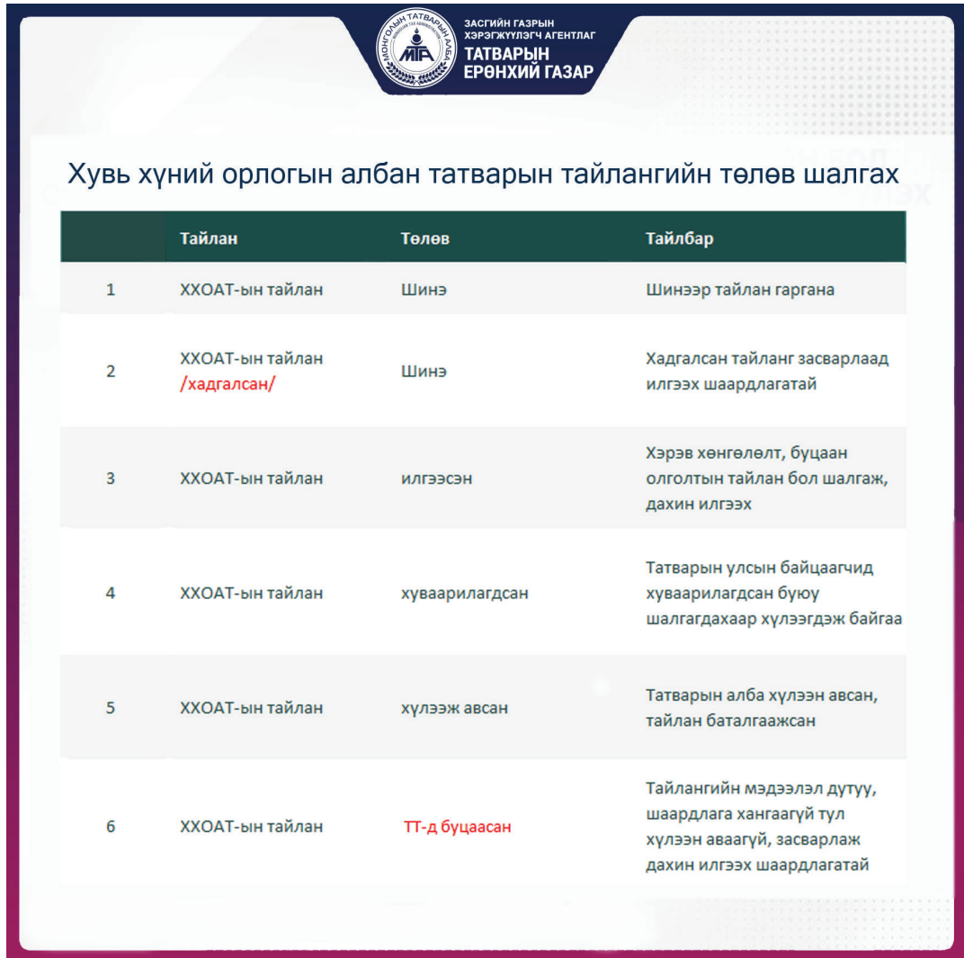
Зураг. Цахим тайлангийн системээр илгээсэн тайлангийн төлөв