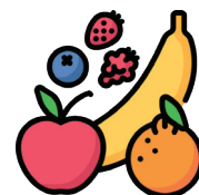
Жимс, жимсгэнэ, түүний үр, суулгац