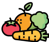
Төмс, хүнсний ногоо, түүний үр