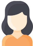
Монгол Улсын иргэн

Тухайн татварын жилд албан татвар ногдох орлого олсон, эсхүл хуульд заасны дагуу албан татвар төлөх үүрэг бүхий дараах хувь хүн албан татвар төлөгч байна.